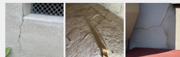
基礎のヒビ 布基礎のヒビ 外壁のヒビ